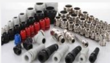
PRENSA CABOS E ACESSÓRIOS

Produtos associados e que são essenciais nas suas instalações também podem ser encontrados em nossos estoques. Não deixe de nos consultar, acesse também www.eurocabos.com.br