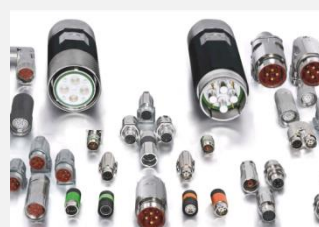
CONECTORES CIRCULARES PARA SERVOMOTORES E ENCODERS M23 / M40 / M58