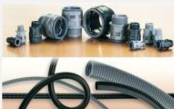
DUTOS E TERMINAÇÕES PARA CABOS