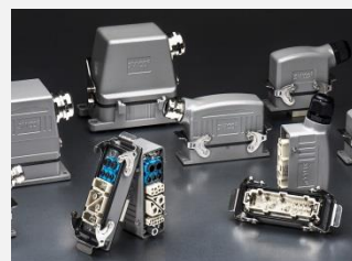
TOMADAS MULTIPOLARES BLINDADAS